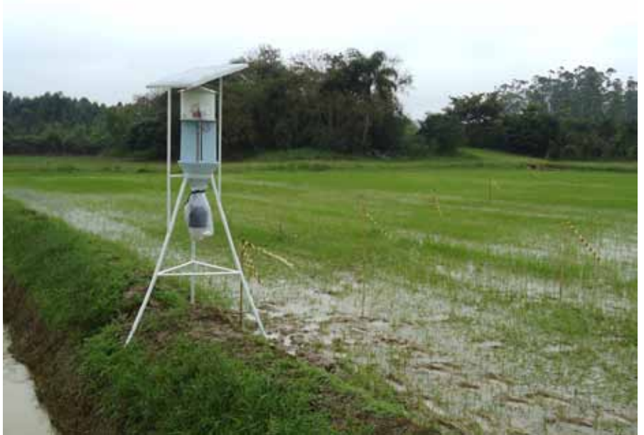
Figura 1. Armadilha luminosa autônoma Sonne instalada em lavoura de arroz irrigado em Itajaí, SC

Essa lâmpada de LEDs foi projetada e construída em formato tubular, com os componentes montados em discos empilhados, para emitir luz radial ao longo da face cilíndrica da lâmpada (KNABBEN, 2014) (Figura 2A). Seu acen-